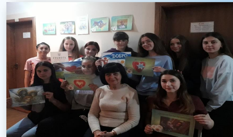
Виховний захід присвячений дню сім'ї (2023р.)