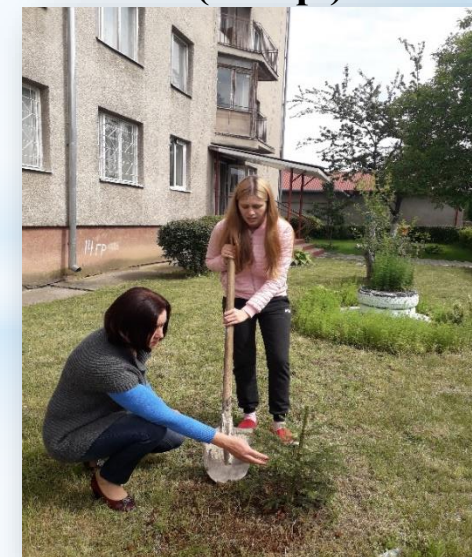
Акція « Посади дерево» (2021р.)