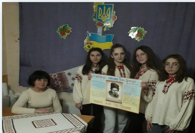
Переможці конкурсу декламаторів поезії Шевченка (2023р.)