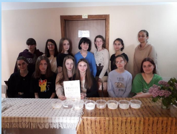
Учасники конкурсу майбутніх кухарів (2022 р.)