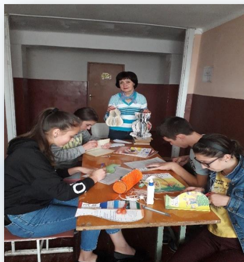
Акція « Дамо нове життя старій книзі» (2021 Р.)