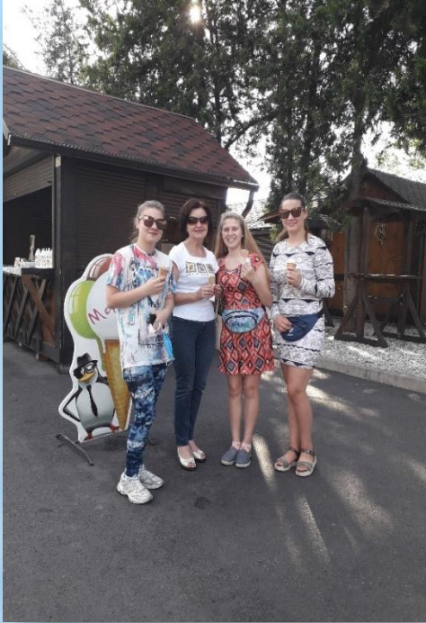
День дозвілля для дітей сиріт та дітей позбавлених батьківського піклування 2020 р.