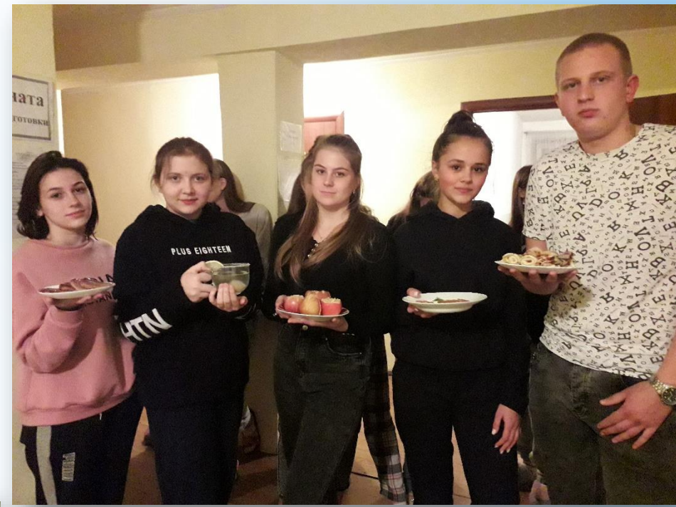
Майстер клас «Вчимося смачно готувати» 2021р.