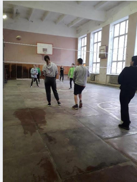
Змагання з волейболу 2021р.