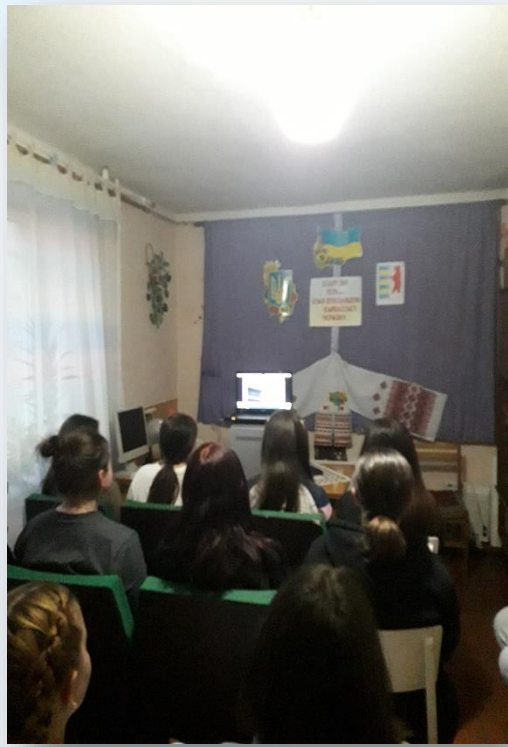
Перегляд фільму «Історію Закарпаття» 2022р.