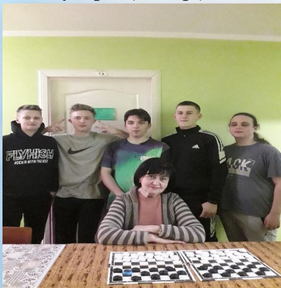
Змагання з шашок (2022 р.)